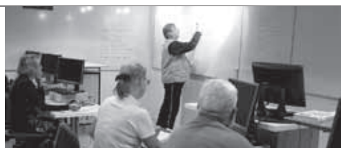
På rätt kurs med Dis-Öst.

Välj därefter adressändring och vidare Anmäl adressändring.