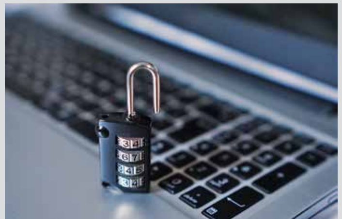
Datorn och säkerheten — 4