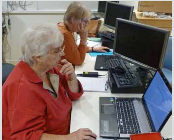
Gå på kurs med DIS-Öst Akademin — 5