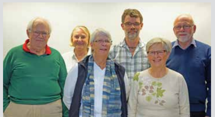
DIS-Öst Programgrupp — 2