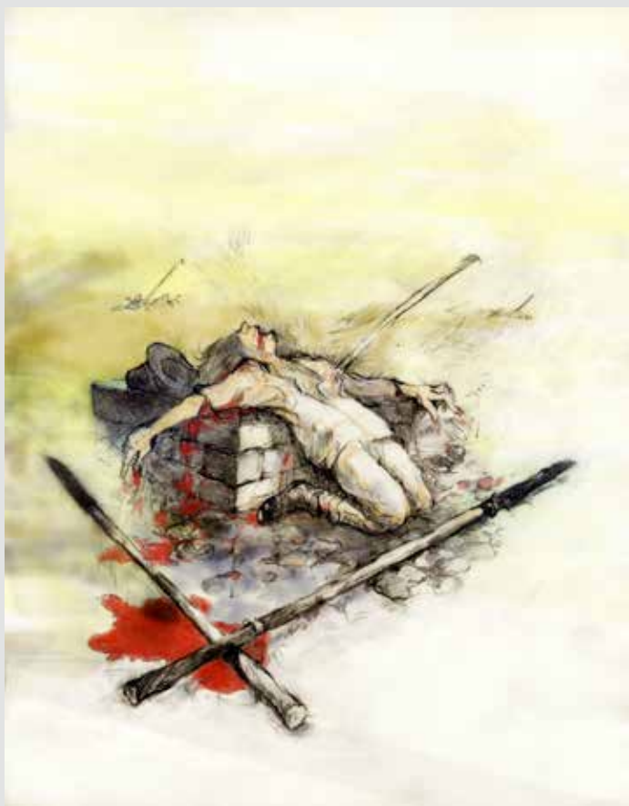
Dalabönders kamp mot adeln — 2