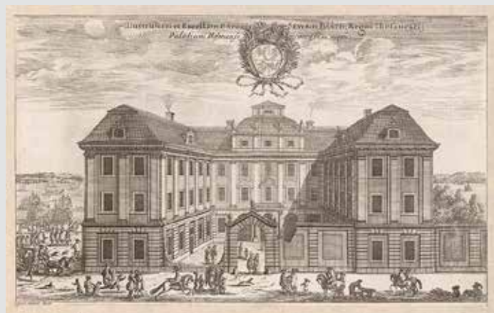
Båtska palatset — 9