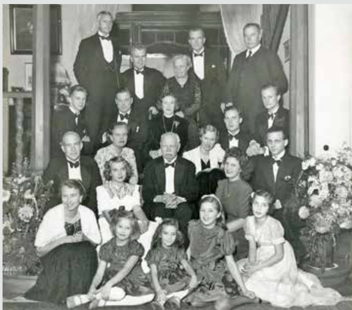
Släktmöten — 5