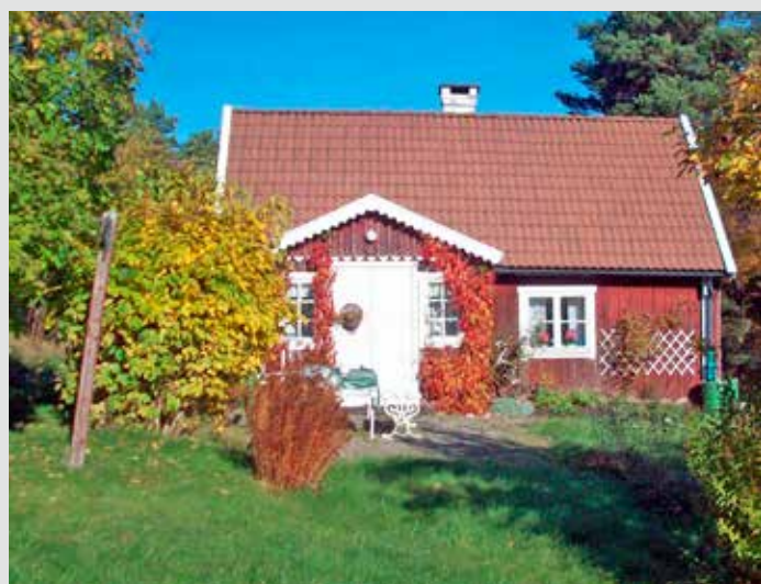
Mickrums båtsmanstorp, nr 39, Örnstorp — 7